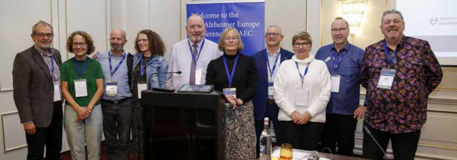
Europese werkgroep voor mensen met dementie

groepen kwam ik terecht in een nieuwe en warme familie. Ik ben trots dat ik deel mag uitmaken van de groep. Je kunt er niets verkeerd zeggen of doen. Iedereen deelt er open zijn of haar verhaal.”